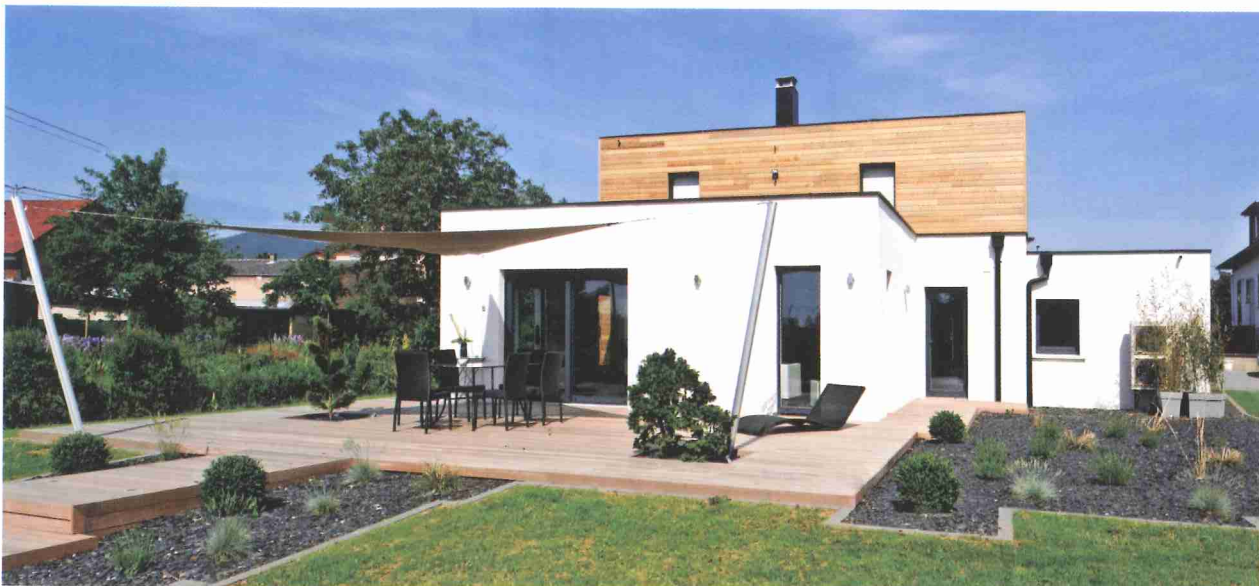
Maisons Stéphane Berger

Maisons Stéphane Berger a développé depuis trois ans Concept Home, une gamme offrant l'innovation au meilleur prix. Cette habitation récompensée aux trophées Bleu Ciel d'EDF en fait partie.